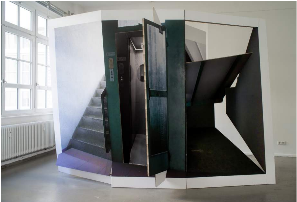
Werk van Lucia Luptakova te zien tijdens BIG ART.